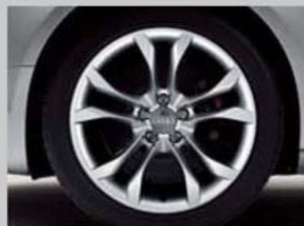
5双辐S设计铸铝轮辋8.5J x 18 轮胎: 245/40 R18 S5 Coupe/Sportback/Cabriolet 标准装备