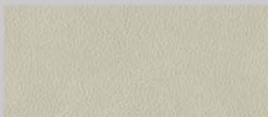
丝质纳帕(Silk Nappa)真皮 珍珠银 SB/SE S5 Coupe 标准装备