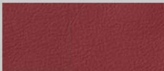
丝质纳帕(Silk Nappa)真皮 岩浆红 TR/SF S5 Coupe 标准装备