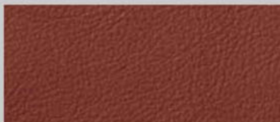
丝质纳帕(Silk Nappa)真皮 野马棕 JZ/SG S5 Coupe/Sportback 标准装备