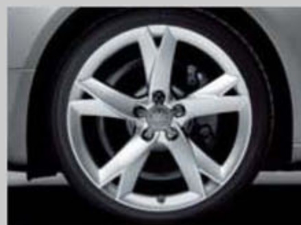
5双辐Y型铸铝合金轮辋 8.5J x 19 轮胎: 255/35 R19 Y S5 Cabriolet 选装装备