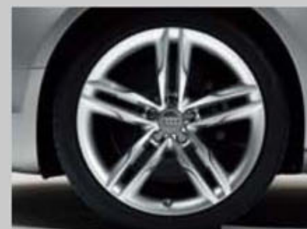
5双辐星型铸铝轮辋 8.5J x 19 轮胎: 255/35 R19 Y S5 Cabriolet 选装装备