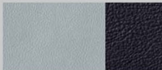
丝质纳帕(Silk Nappa)真皮 银/黑色 SP/SQ S5 Sportback/Cabriolet 标准装备