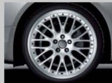
奥迪专享铸铝轮辋20辐双辐设计9J x 19 轮胎: 255/35 R19 Y S5 Coupe/Cabriolet 选装装备