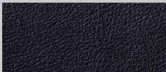
丝质纳帕(Silk Nappa)真皮 黑色 ZM/SC S5 Coupe/Sportback/Cabriolet 标准装备